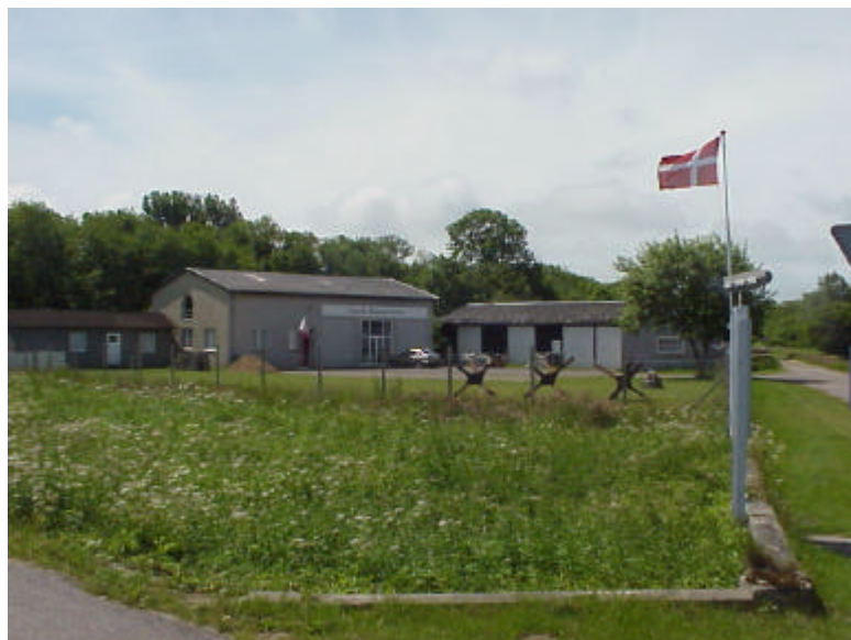
Zeppelin-Museum Tondern im Sommer 2002